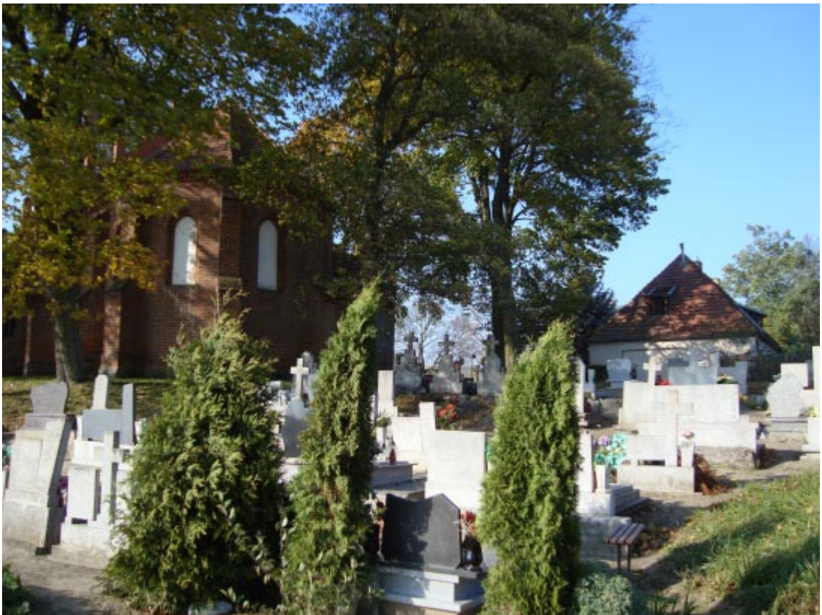
8. Łopatki Polskie. Cmentarz przykościelny z prawej strony plebania, widok od południowego wschodu.