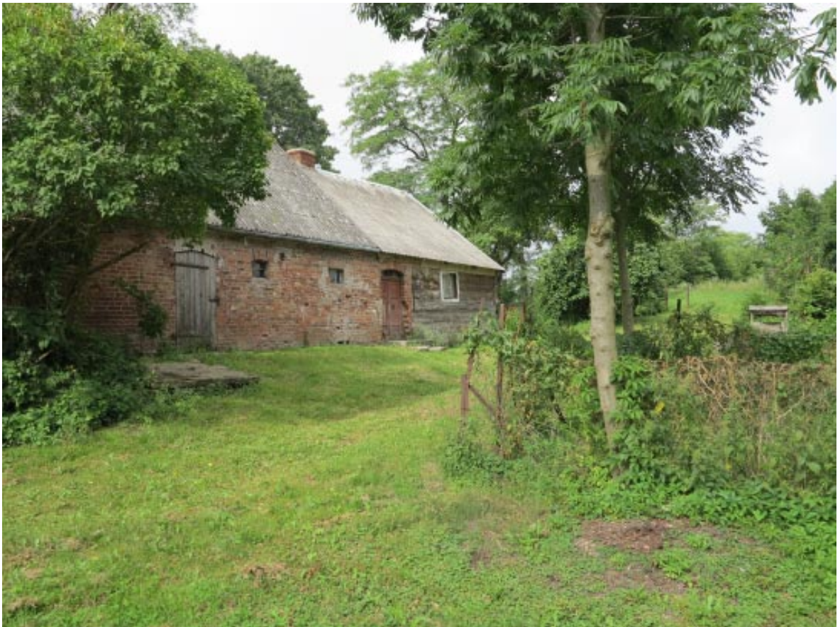
19. Osieczek. Zabytkowa zagroda wiejska w sąsiedztwie projektowanego parku, z prawej strony widoczny warzywnik.