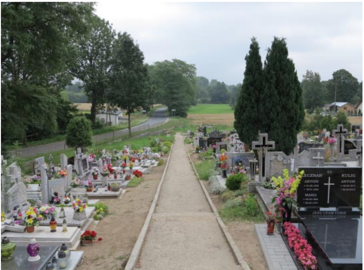
10. Osieczek. Cmentarz przykościelny, główna aleja widok w kierunku wschodnim.