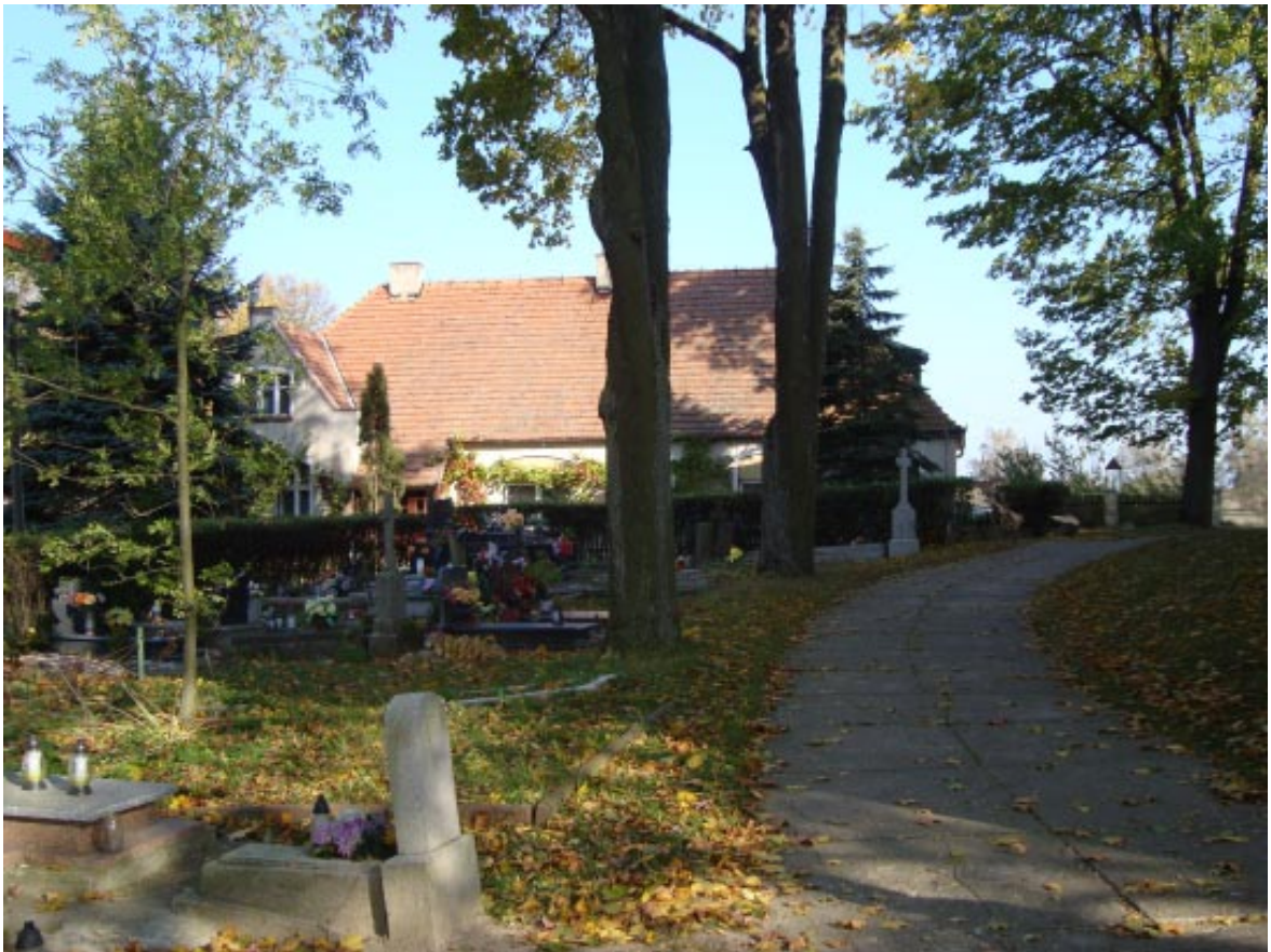
7. Łopatki Polskie. Cmentarz przykościelny w głębi plebania, widok od południowego zachodu.