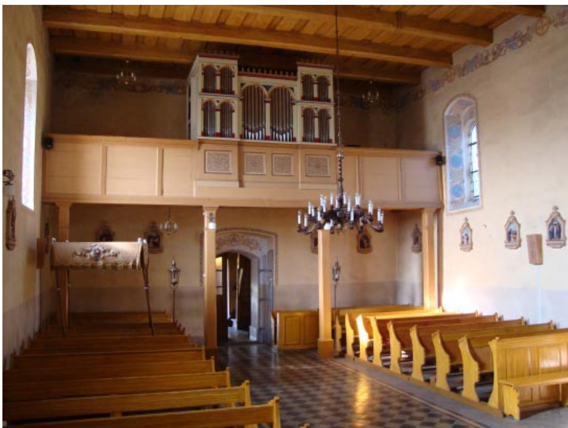
8. Osieczek. Wnętrze kościoła, widok na organy.