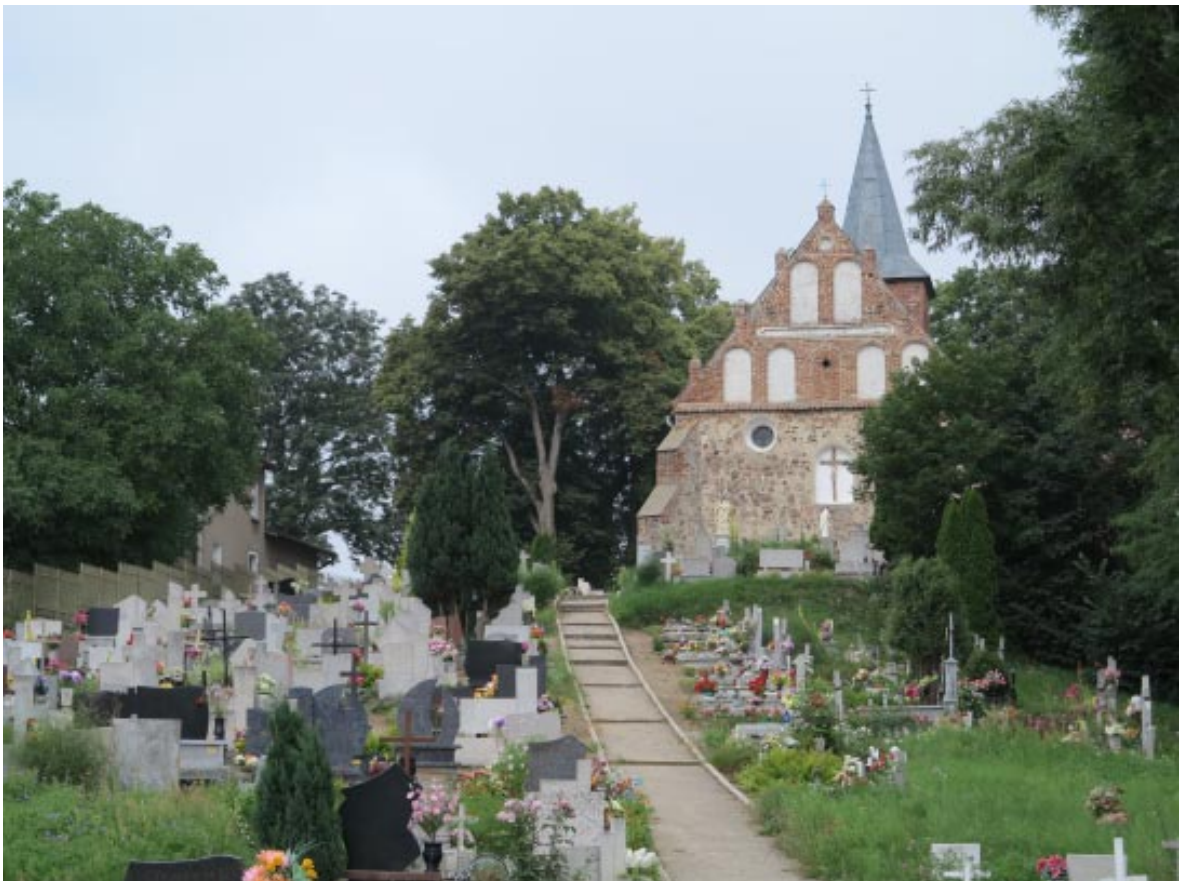
12. Osieczek. Widok na cmentarz i kościół od strony wschodniej.