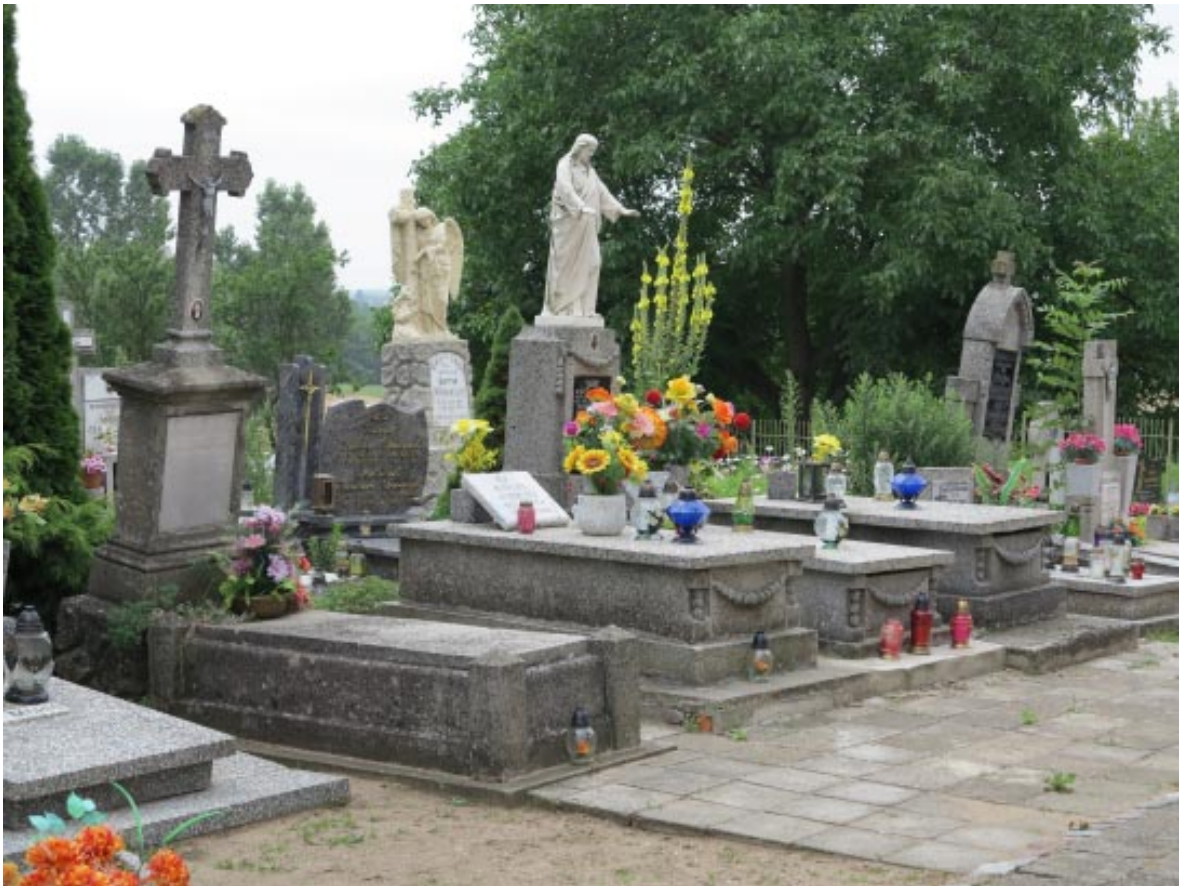
11. Osieczek. Cmentarz przykościelny, historyczne nagrobki.