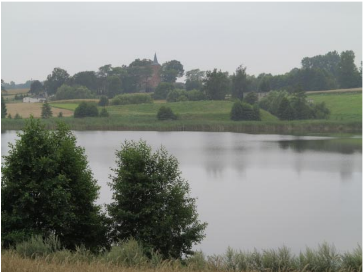
26. Osieczek. Widok na grodzisko i kościół z punktu widokowego z nad jeziora Wielkiego.