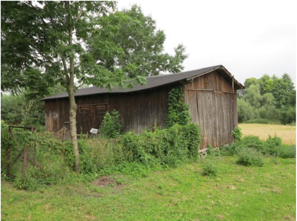
20. Osieczek. Stodoła w zagrodzie wiejskiej w sąsiedztwie projektowanego parku, widok od południowego wschodu.