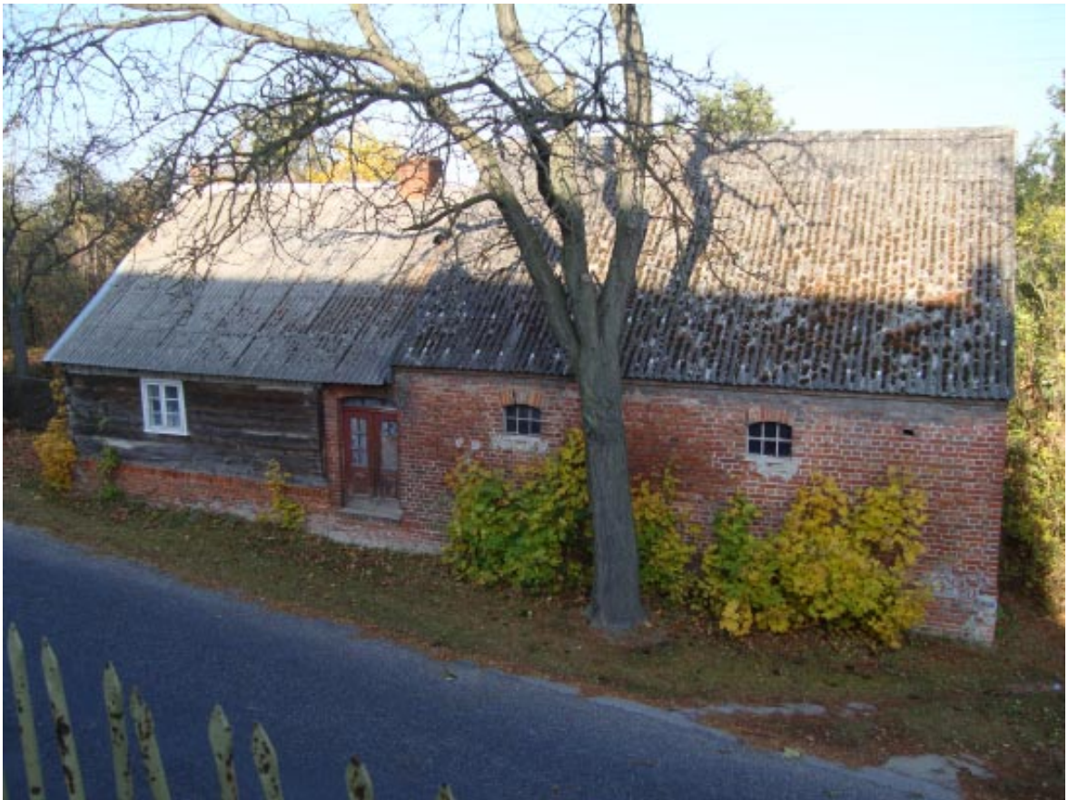
17. Osieczek. Zabytkowa zagroda wiejska w sąsiedztwie projektowanego parku, widok od strony kościoła.