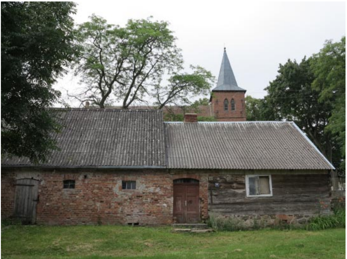
18. Osieczek. Zabytkowa zagroda wiejska w sąsiedztwie projektowanego parku, widok od podwórza.