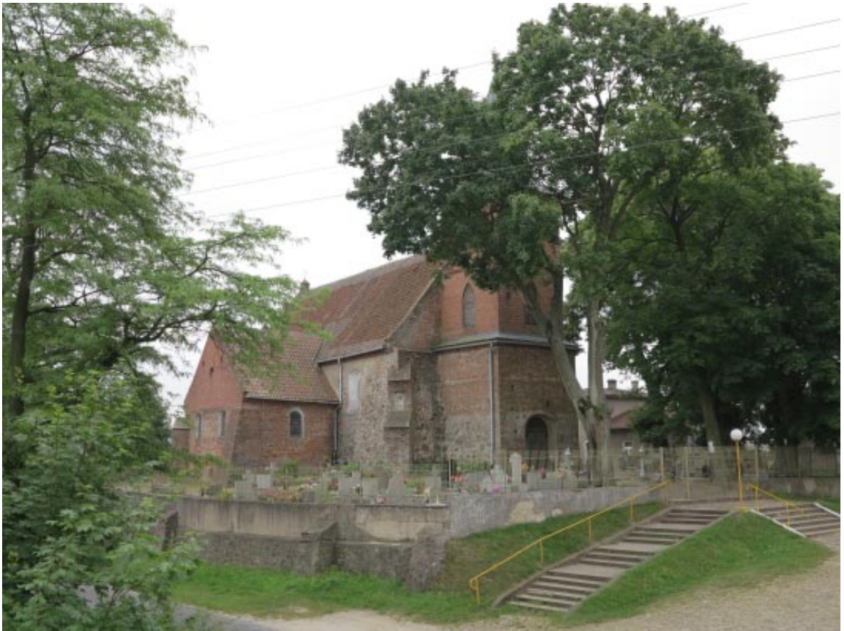
5. Osieczek. Widok na kościół od strony północno-zachodniej.