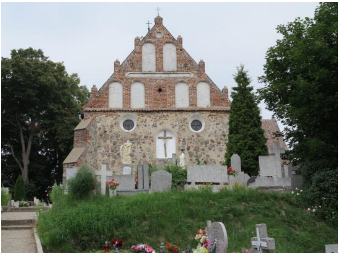
6. Osieczek. Widok kościoła pw. św. Katarzyny od strony wschodniej.