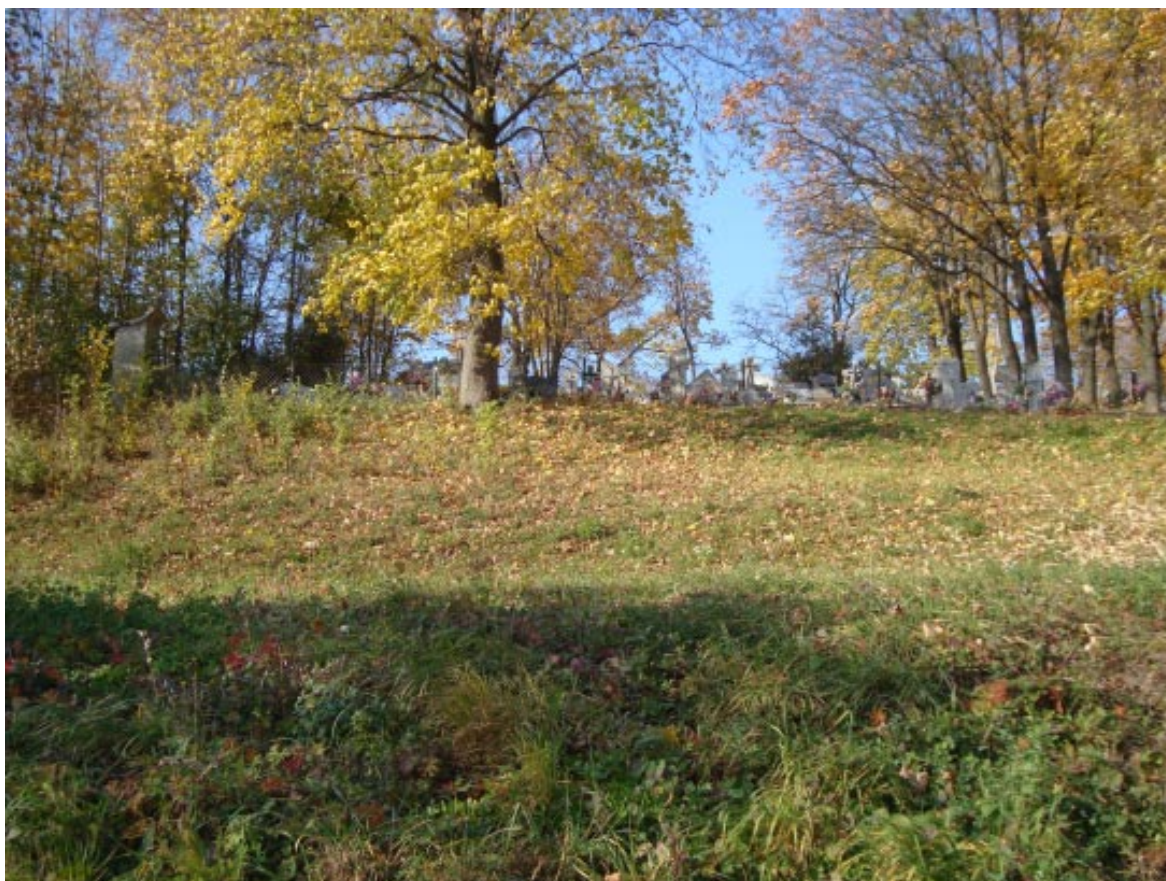
9. Łopatki Polskie. Cmentarz na wzgórzu, widok od południa.