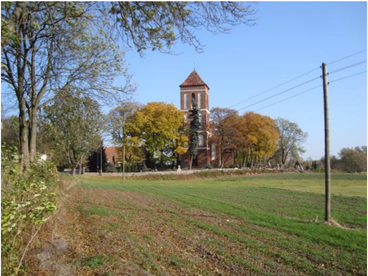
1. Łopatki Polskie. Panorama projektowanego parku z kościołem i plebanią, widok od południowego zachodu.