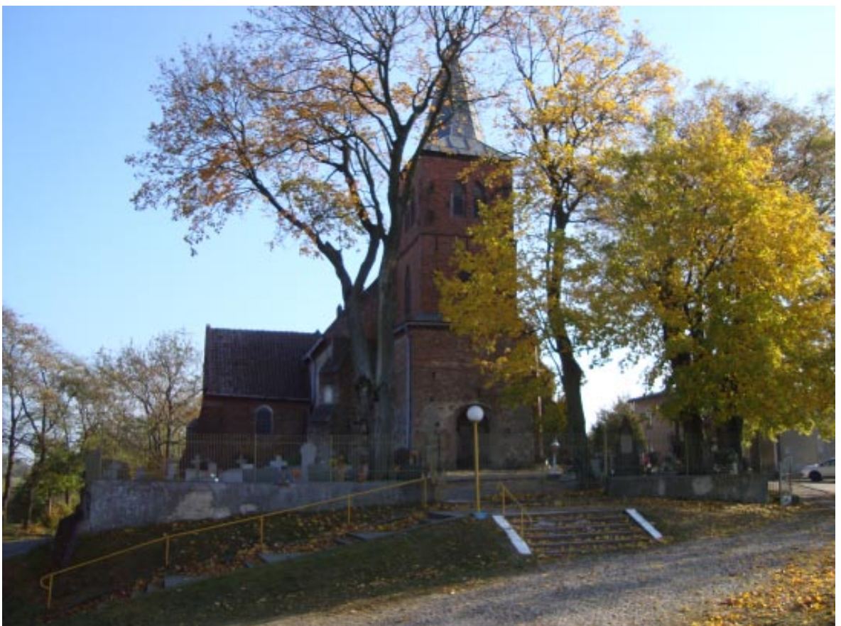
4. Osieczek. Widok kościoła pw. św. Katarzyny od strony zachodniej w porze jesiennej.