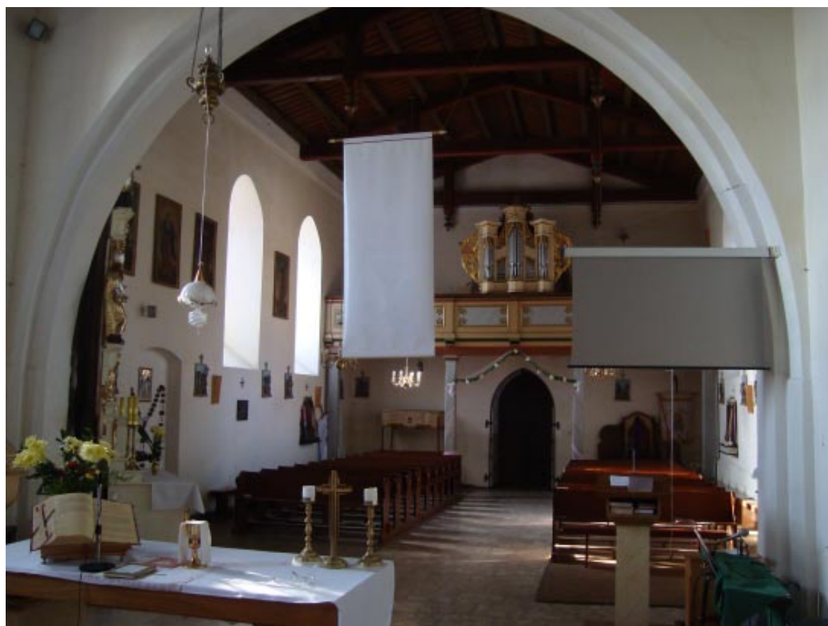
6. Łopatki Polskie. Kościół pw. św. Marii Magdaleny, widok na organy.