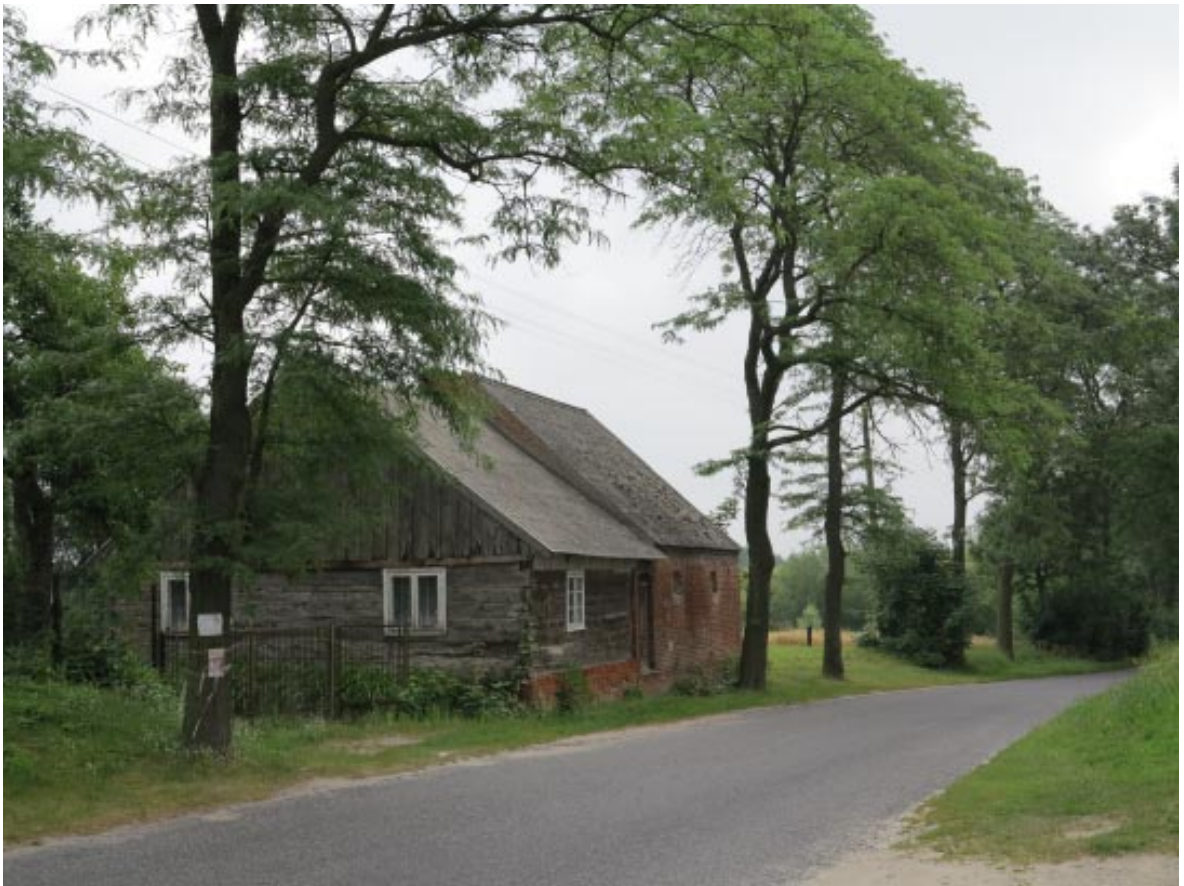
15. Osieczek. Zabytkowa zagroda wiejska w sąsiedztwie projektowanego parku przy alei zieleni wysokiej, widok od zachodu.