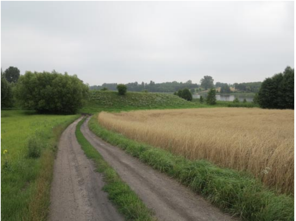
27. Osieczek. Strefa widokowa z drogi na grodzisko.