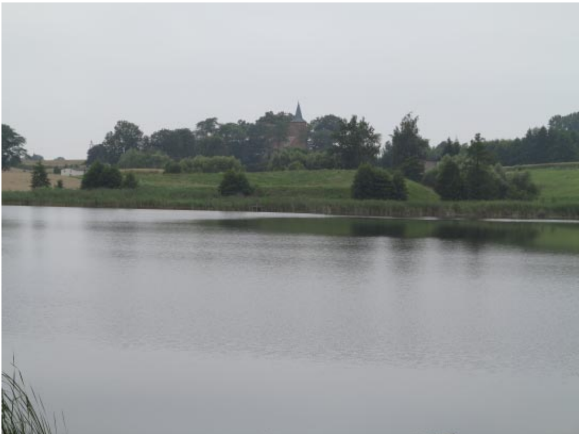
2. Osieczek. Widok grodziska od strony jeziora Wielkiego w tle wieża kościoła.