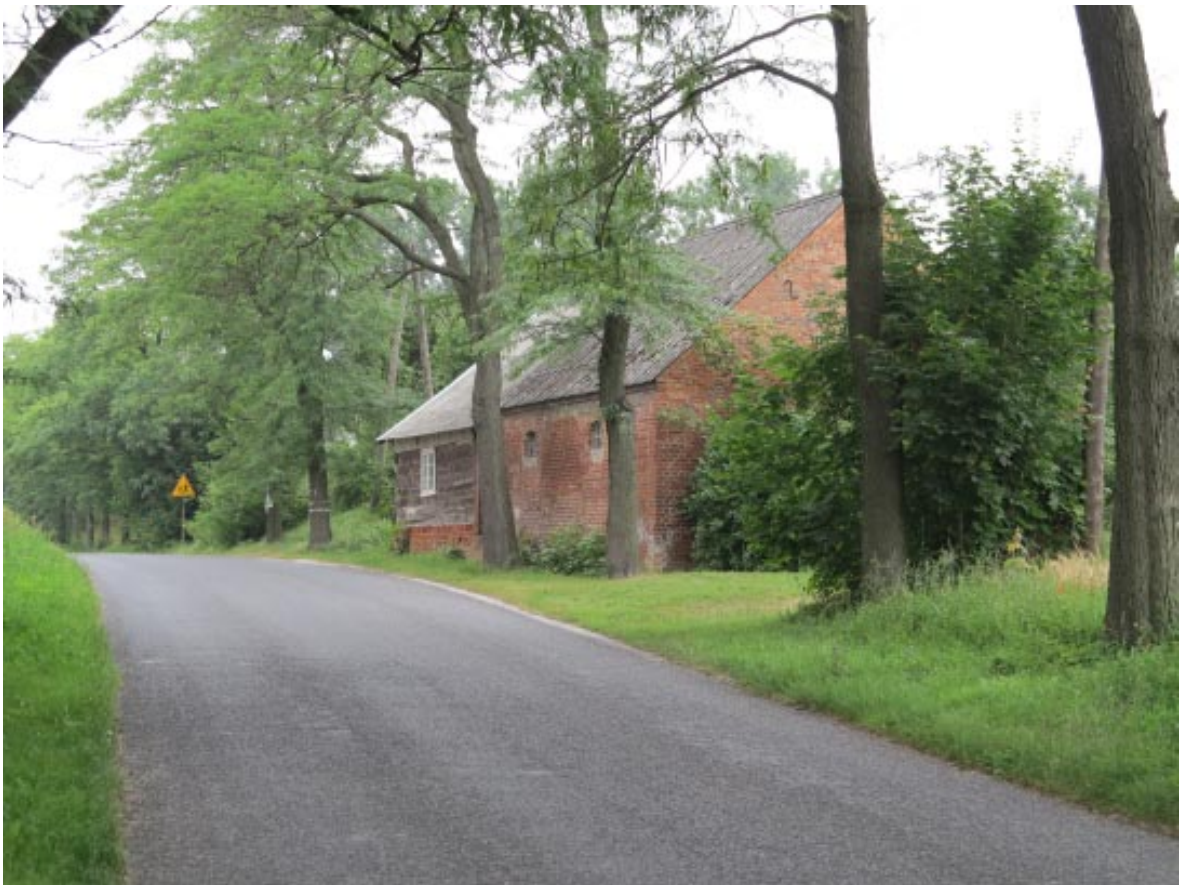
16. Osieczek. Zabytkowa zagroda wiejska w sąsiedztwie projektowanego parku przy alei zieleni wysokiej, widok od wschodu.