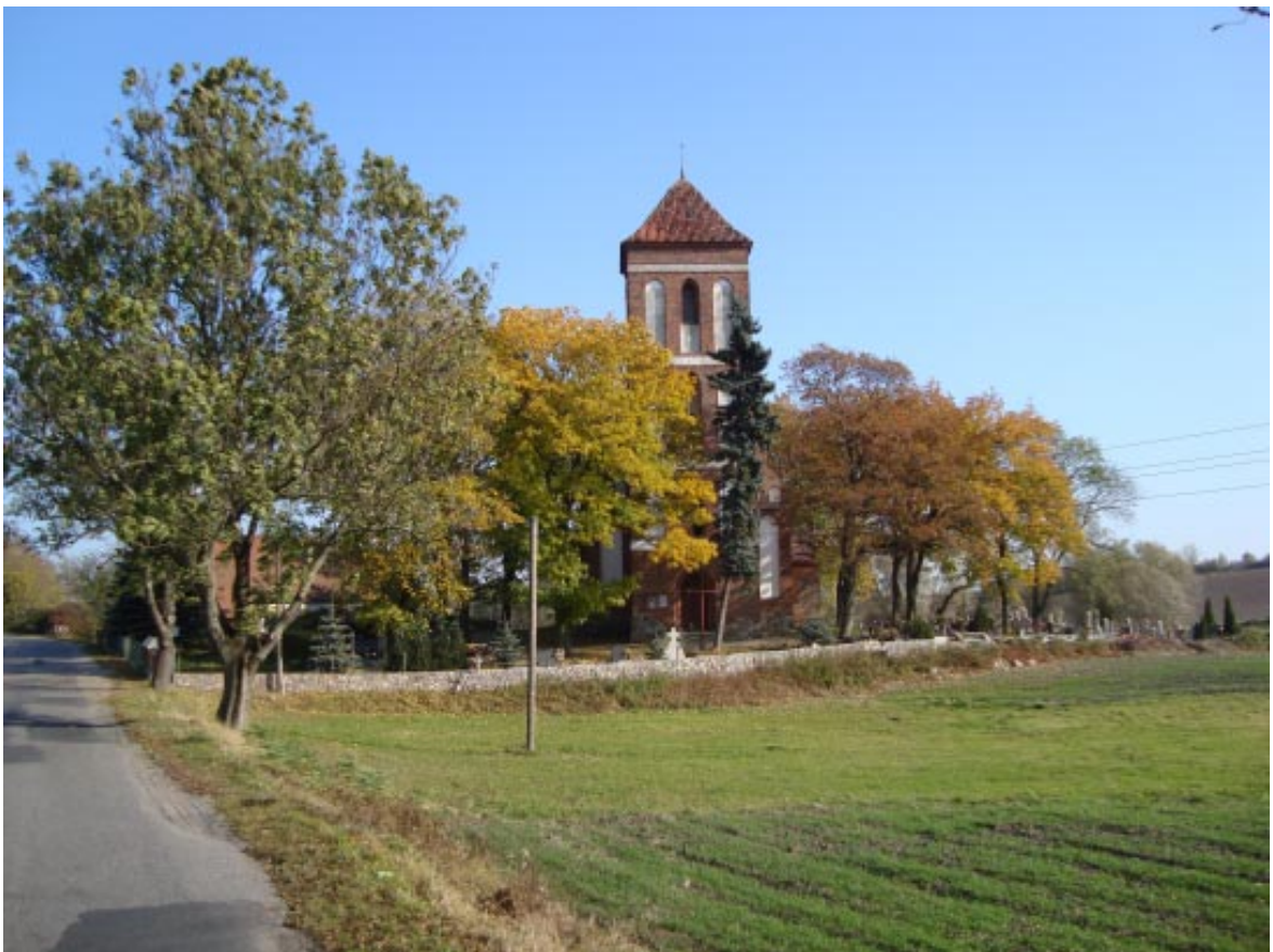
2. Łopatki Polskie. Panorama projektowanego parku z kościołem i plebanią - ujęcia drugie.