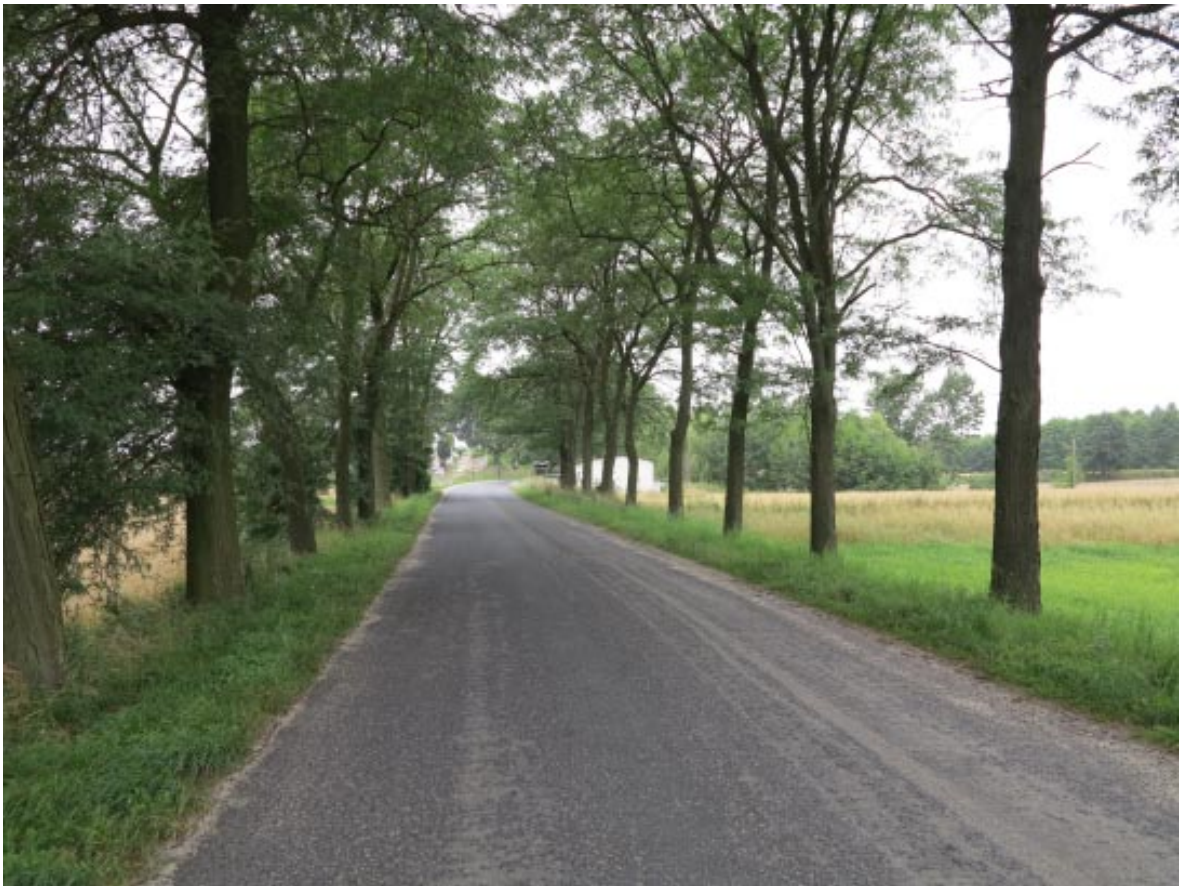
29. Osieczek. Widok na aleję od wschodniej granicy projektowanego parku.