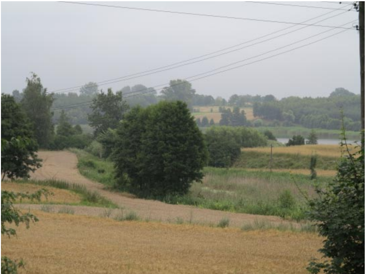
23. Osieczek. Strefa widokowa na grodzisko od strony kościoła.