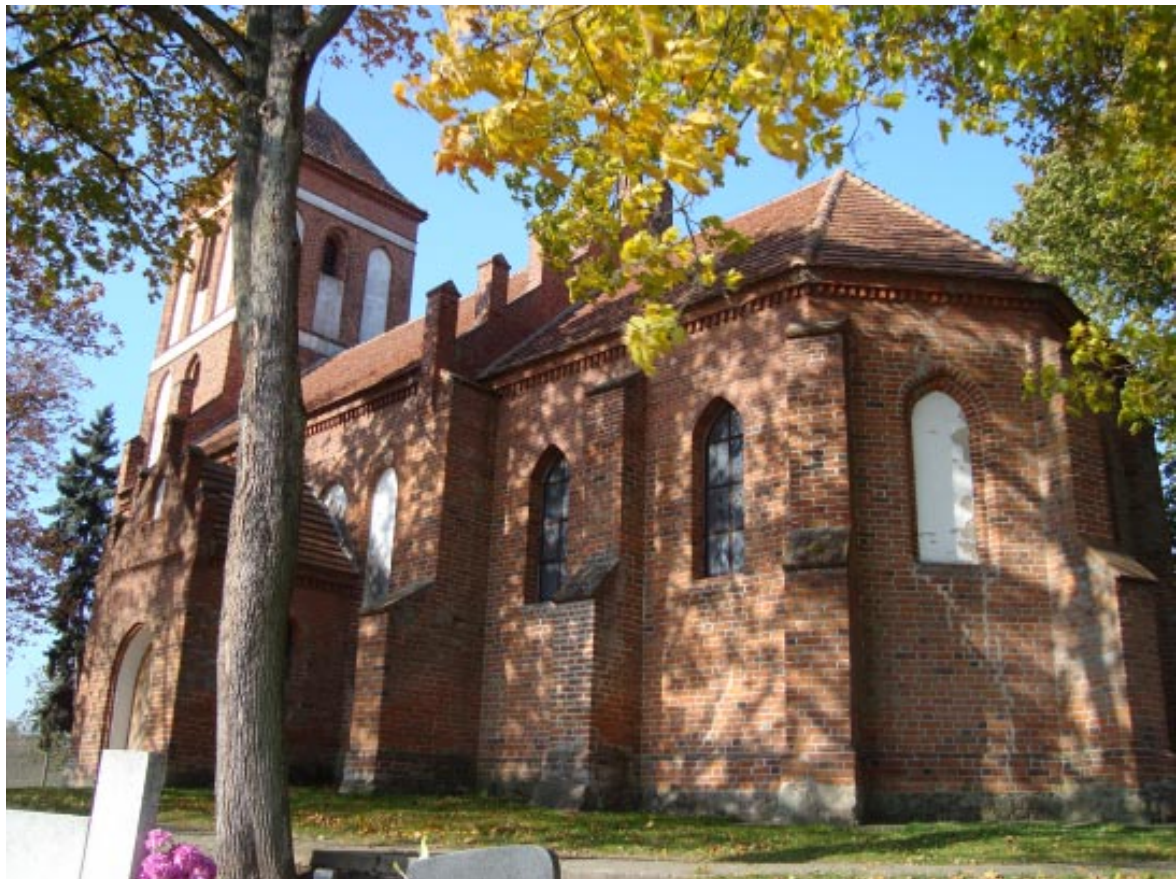
4. Łopatki Polskie. Kościół pw. św. Marii Magdaleny widok od prezbiterium.