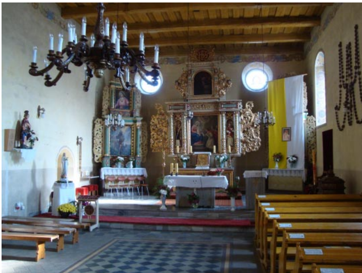
7. Osieczek. Wnętrze kościoła, widok na ołtarz główny.