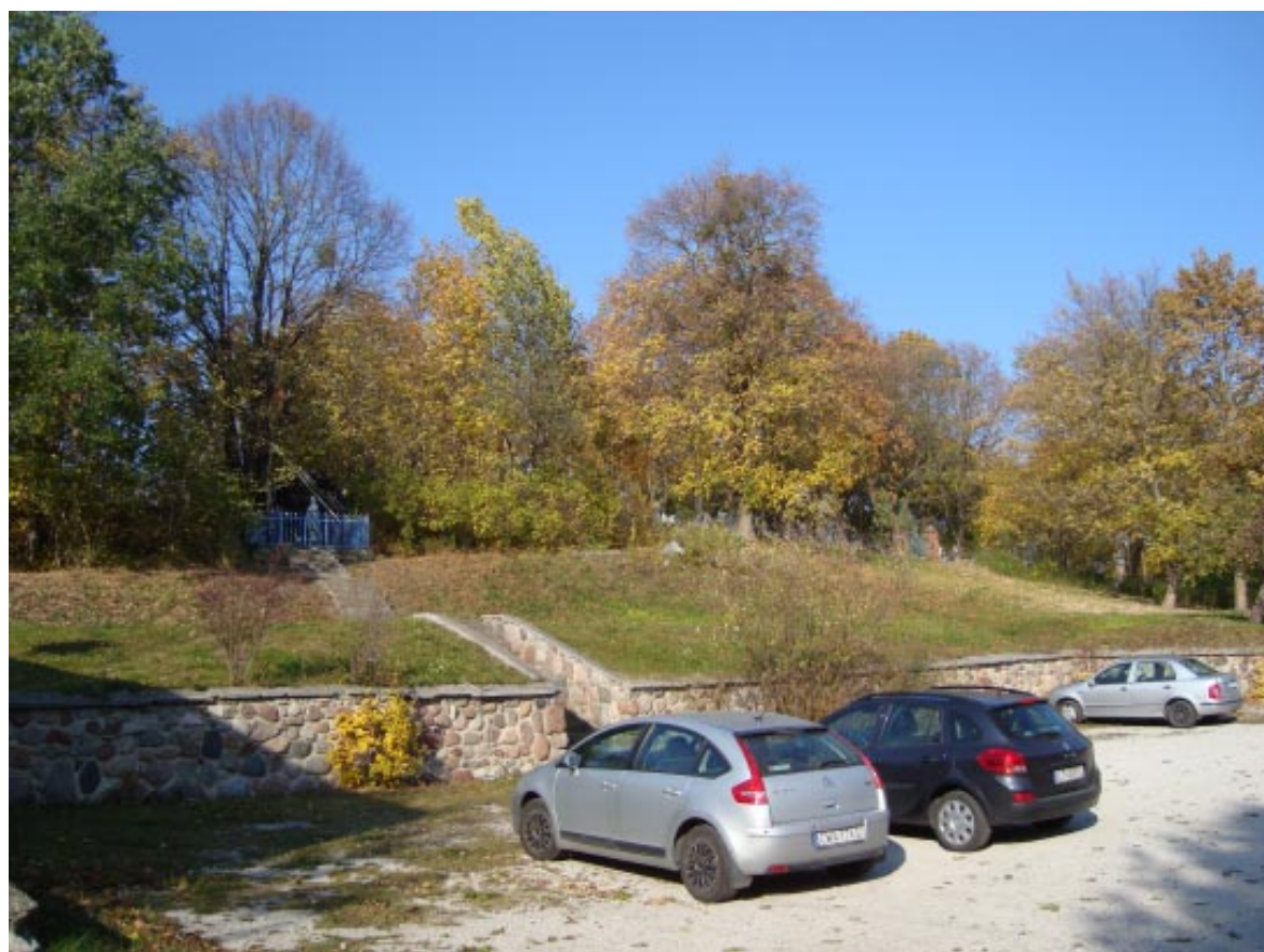
12. Łopatki Polskie. Strefa widokowa kościół - cmentarz na wzgórzu.