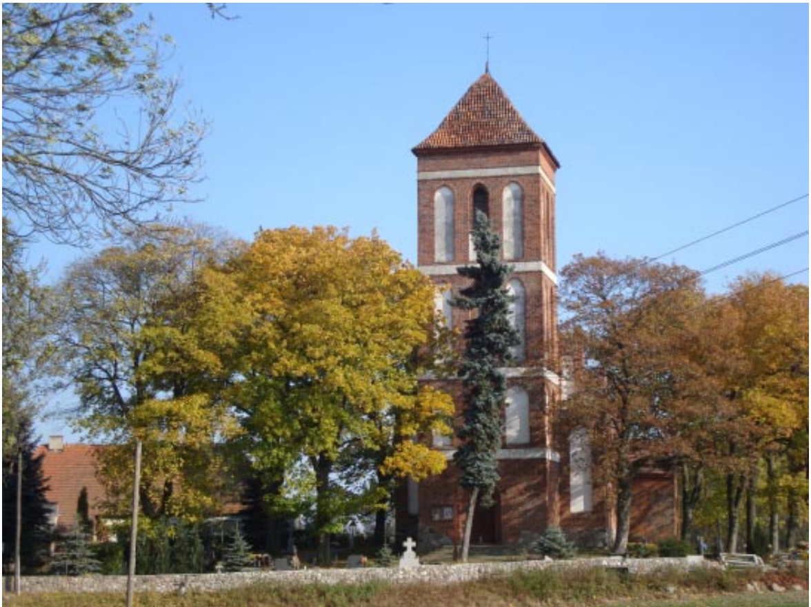
3. Łopatki Polskie. Kościół pw. św. Marii Magdaleny z plebanią.