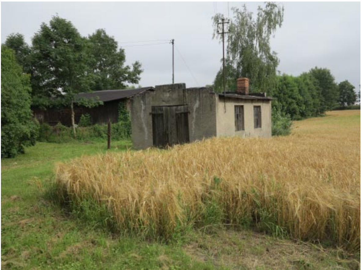
22. Osieczek. Historyczna kuźnia przy zabytkowej zagrodzie w sąsiedztwie projektowanego parku.