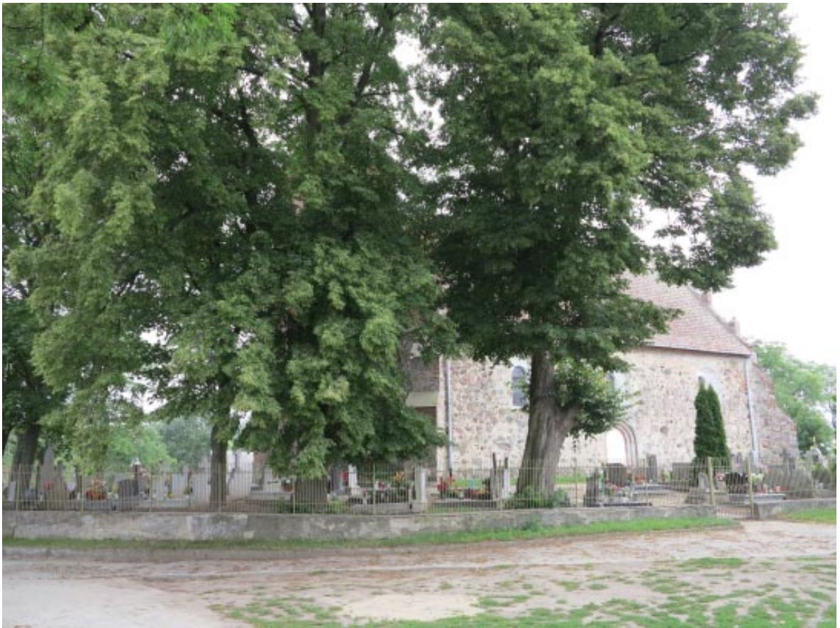
9. Osieczek. Cmentarz przykościelny, widok od południowego-zachodu (od strony plebanii).