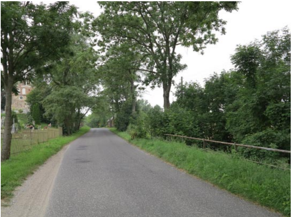
30. Osieczek. Widok na aleję na wysokości cmentarza.