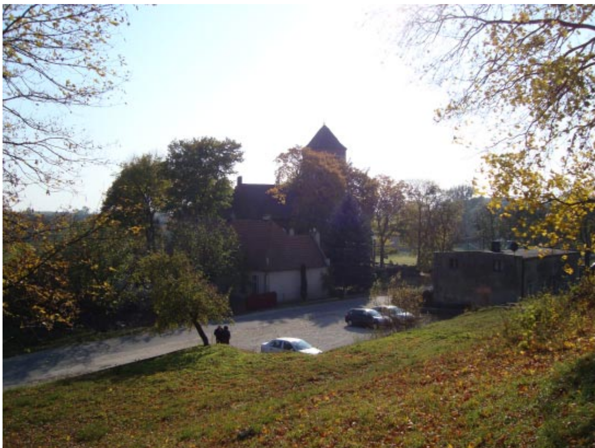
11. Łopatki Polskie. Strefa widokowa cmentarz na wzgórzu - kościół.