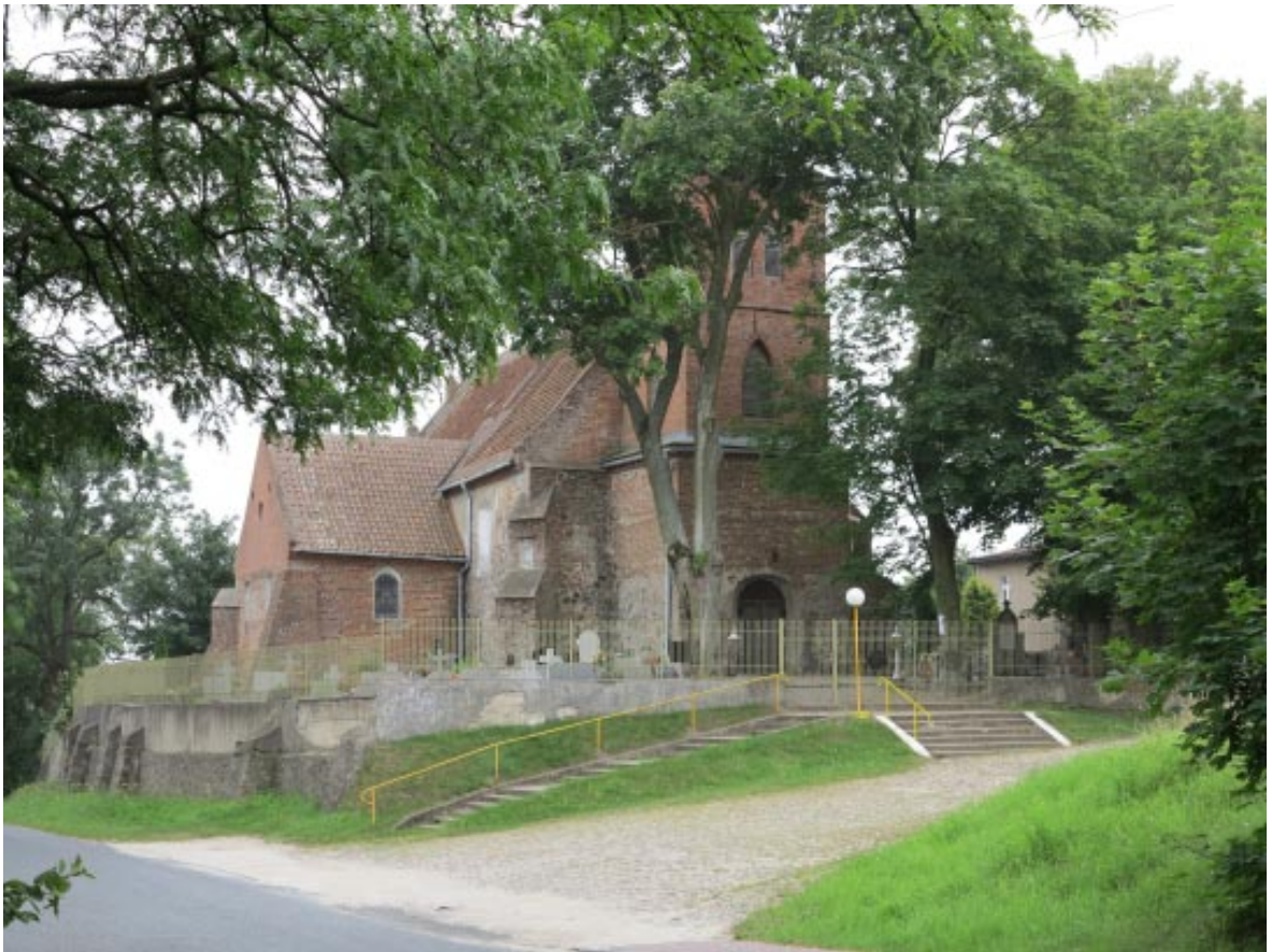
3. Osieczek. Widok kościoła pw. św. Katarzyny od strony zachodniej w porze letniej.