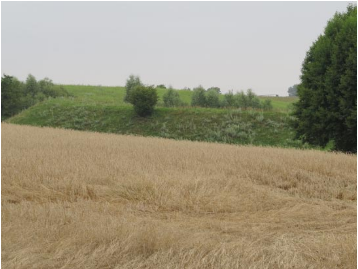
1. Osieczek. Widok grodziska od strony drogi powiatowej Wąbrzeźno-Brudzawy.