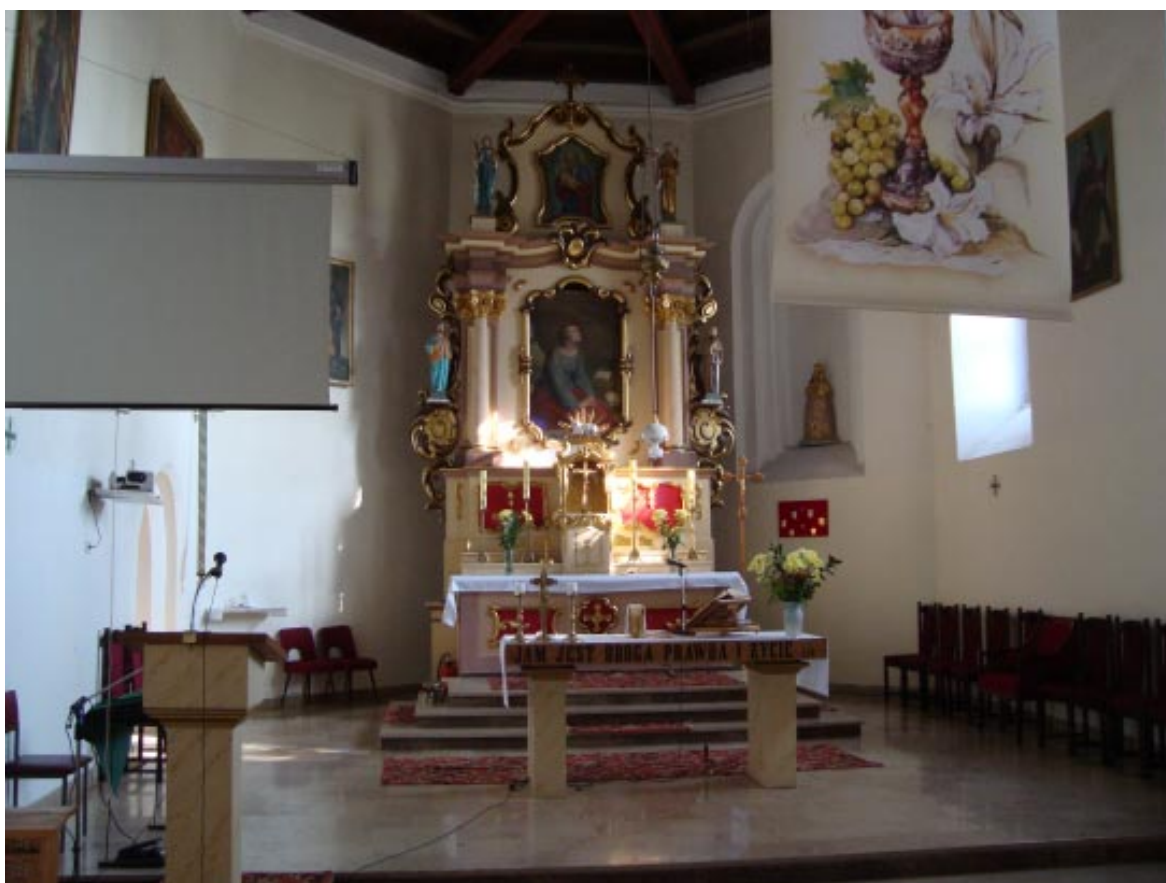
5. Łopatki Polskie. Kościół pw. św. Marii Magdaleny, widok na ołtarz główny.