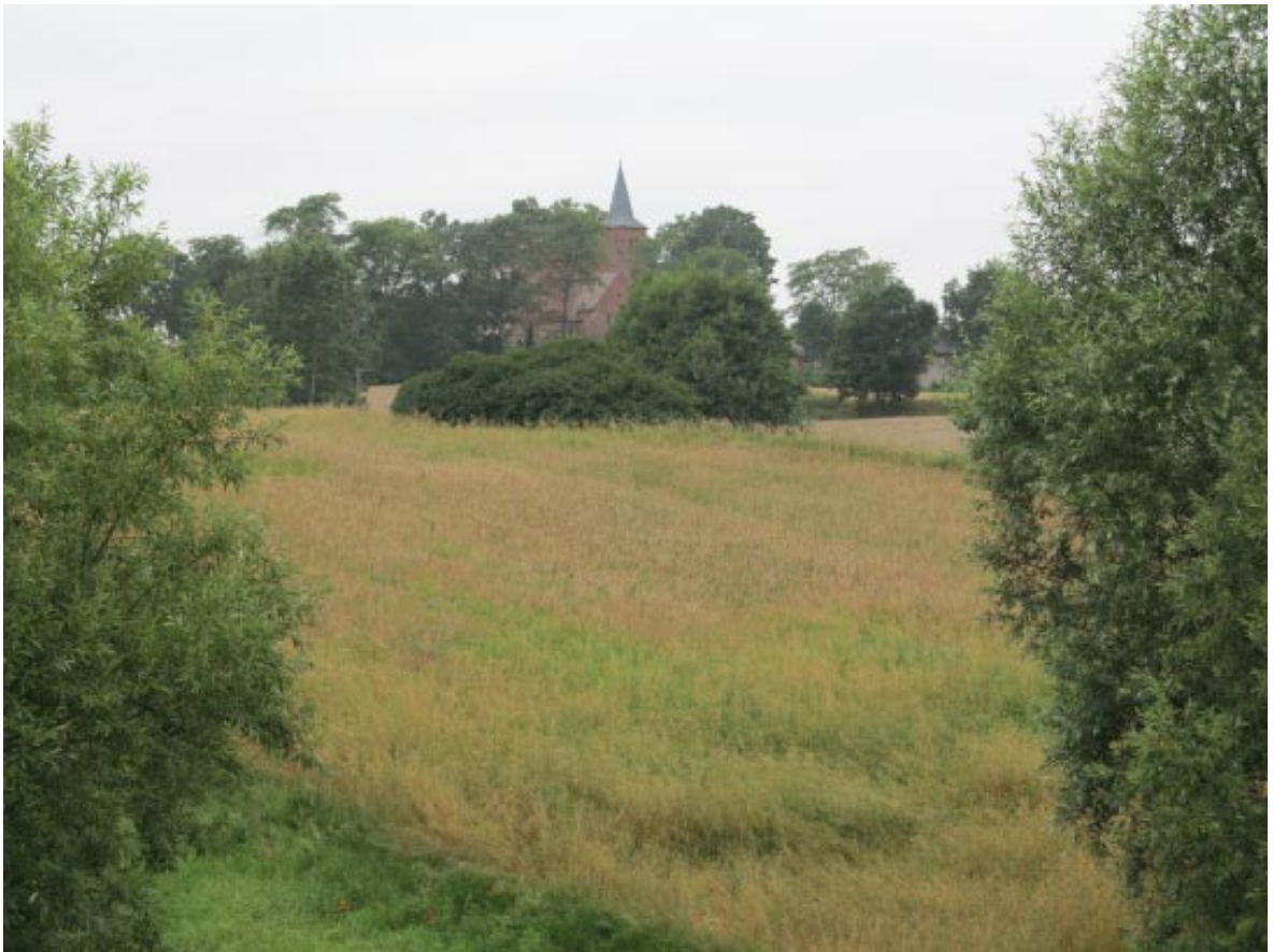
25. Osieczek. Strefa widokowa z grodziska na kościół.