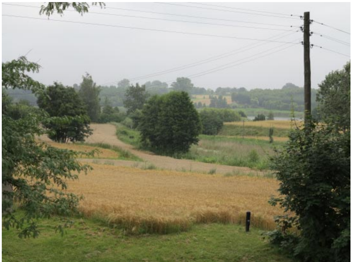
24. Osieczek. Strefa widokowa na grodzisko od strony kościoła - zbliżenie.