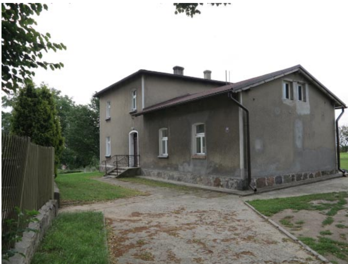
13. Osieczek. Plebania.