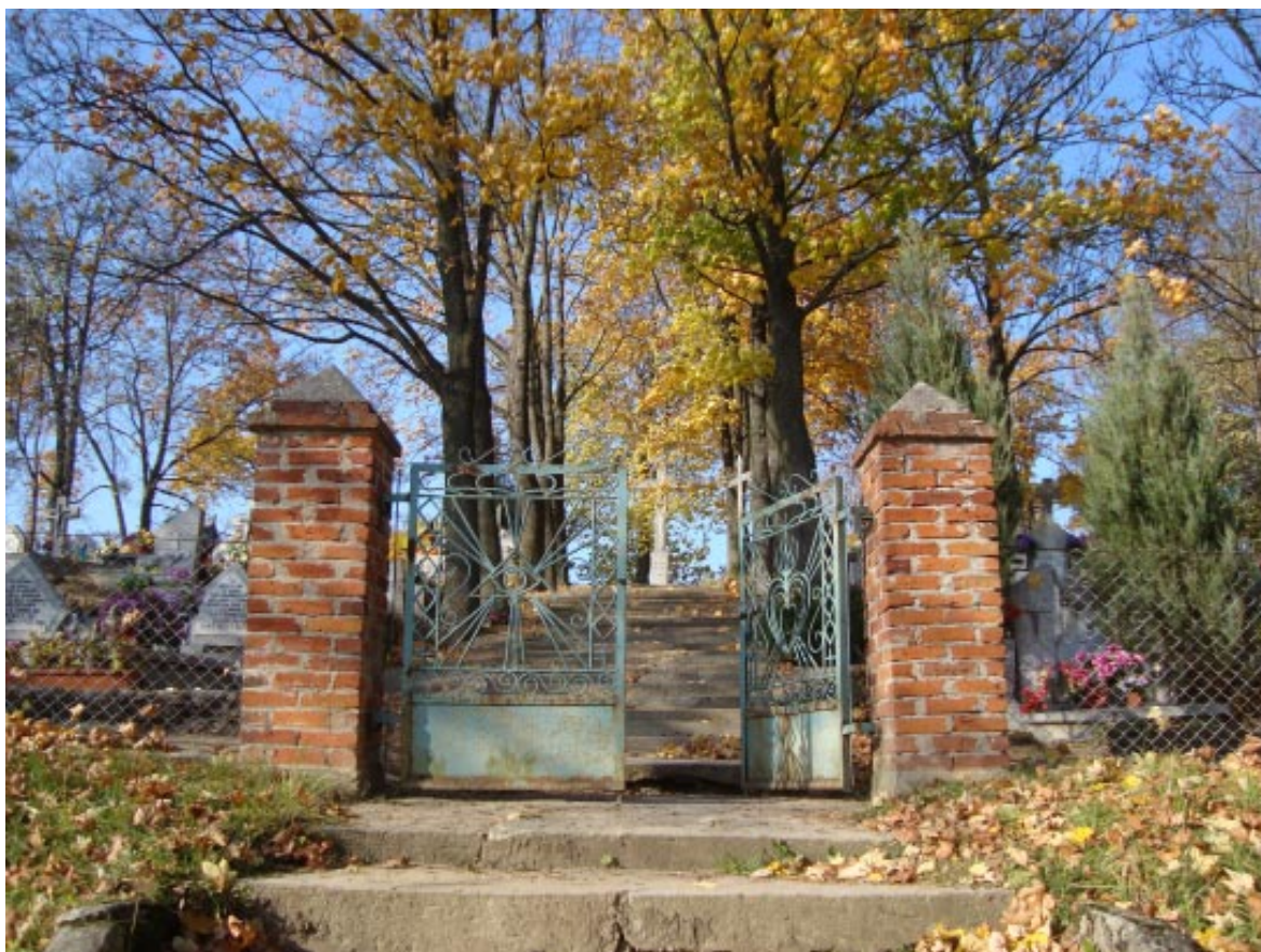
10. Łopatki Polskie. Brama cmentarza na wzgórzu.