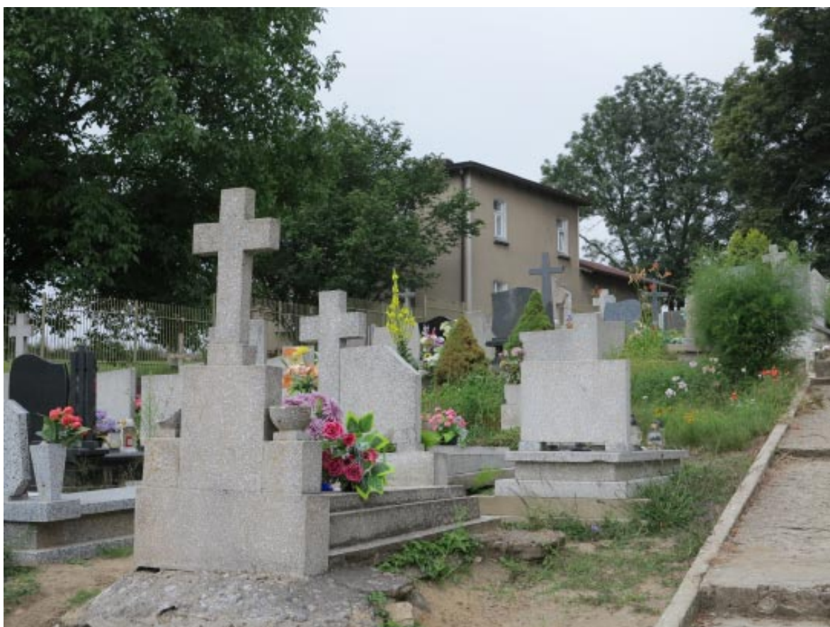
14. Osieczek. Plebania, widok od strony cmentarza.