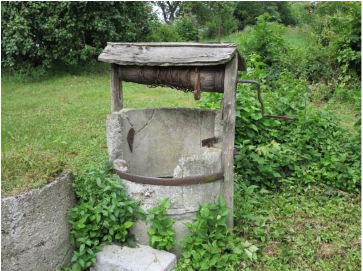
21. Osieczek. Historyczna studnia w zabytkowej zagrodzie w sąsiedztwie projektowanego parku.